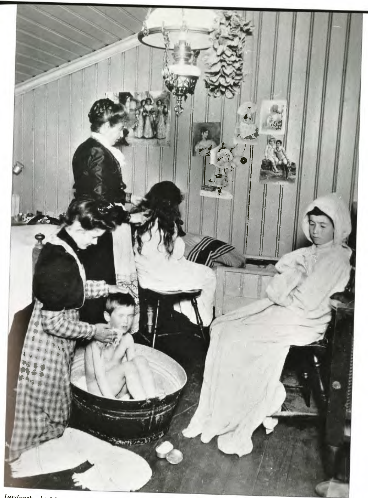
Lørdagsbad på barneværelset 1904 (Foto: Anders B. Wilse. Norsk Folkemuseum).

I 1994 sendte Norsk etnologisk gransking (NEG) ut en landsomfattende spørreliste med tittelen «Personlig hygiene i eldre tid». De informantene som besvarte spørrelisten, var i hovedsak født mellom 1915 og 1930. Gjennom svarene får man derfor et godt inntrykk av hvilken renslighetspraksis befolkningen hadde i mellomkrigstidens Norge. 14 Svarematerialet viser at det for de aller fleste innebar mye arbeid å etterleve de nye renslighetsidealene. Selv om det i stor grad var lagt inn vann i byboligene, var virkeligheten annerledes for mange av dem som bodde i rurale strøk av landet. Vannet måtte her ofte hentes i bøtter fra en nærliggende brønn eller en annen vannkilde. De færreste hadde utslagsvask. Alt vann som med slit og møyne ble båret inn i huset, måtte også bæres ut igjen etter bruk. En innretning som elektrisk varmt-