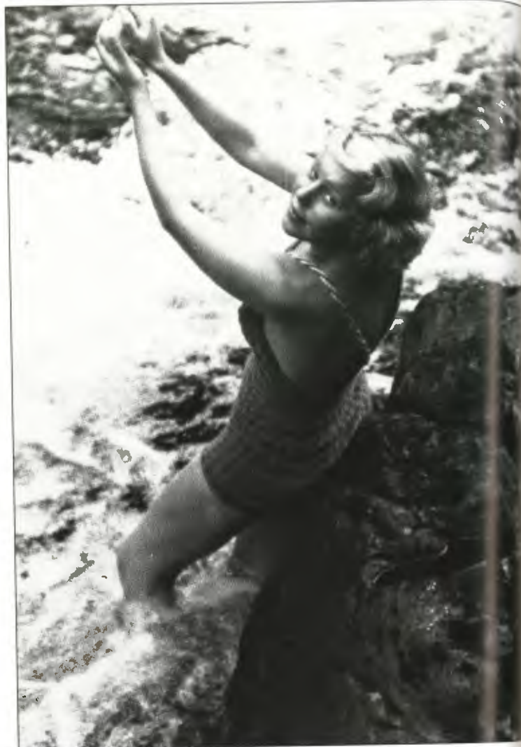
Den rene kroppen sto sentralt i mellomkrigstidens hygieniske oppdragelsesprosjekt. Reklamefoto for såpe, 1938.

Mellomkrigstidens hygieniske oppdragelsesprosjekt endret normene for hvordan kroppen skulle fremstilles og fortolkes. Kroppen som objekt sto sentralt i helsemyndighetenes arbeid med å kartlegge befolkningens fysiologiske tilstand. Samtidig understreket hygienens forkjempere en sammenheng mellom kropp og sjel, ved å tillegge hygien som praksis moralske dimensjoner. Det ble derfor viktig å kunne gi et umiddelbart sansbart inntrykk av renhet, for slik å kunne formidle ens moralske og anstendige «jeg». Forventningen om at kroppens ytre gjenspeiler kroppens indre, sjelelige beskaffenhet, deres indre «jeg», innebærer forståelsen av at mennesket er sin kropp. Dette forholdet betyr at menneskets identitet uløselig er knyttet til dets kroppsliggjørelse. Individ og kropp er to aspekter som til sammen utgjør ett unikt mennes-