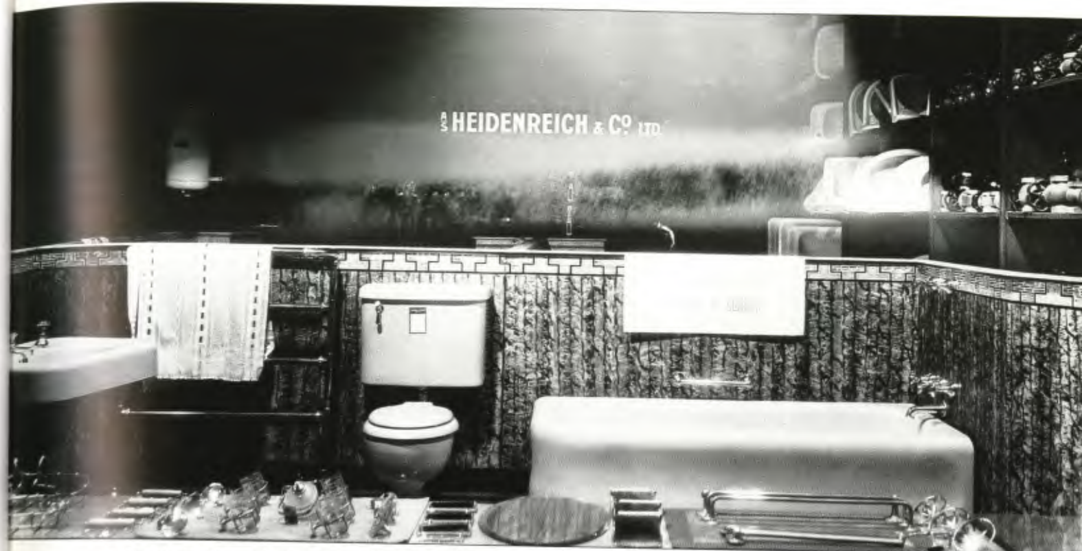
For noen ble eget baderom med vannklosett, vask og badekar tidlig en virkelighet, for andre en fjern drøm som først ble realisert for kun noen tiår siden. Utstilling av baderomsinterior fra 1929 (Foto: Anders. B. Wilse. Norsk Folkemuseum).

I svarmaterialet fra Norsk Etnologisk Gransking er det håndvasken som antyder at nye tanker om hva som var rent og urent var i ferd med å få fotfeste. Både kvinner og menn, unge og gamle, bestrebet seg på å ha rene hender gjennom dagen, men hva som ble ansett som rene hender begrunnes forskjellig i svarene til NEG. De fleste forholdt seg til normer som tilsa at når hendene var synlig møkete og sørgerendene under neglene var blitt umiskjennelig mørke og fyldige, var det på tide med en god omgang med vann og såpe. Det var særlig viktig å sørge for at hendene så tilforlætelig rene ut til måltidene, når man var ute blant folk, og selvsagt til helg og høytid. Men en ny holdning til rent og urent var imidlertid i ferd med å gjøre seg gjeldende, og den var grunnet på erkjennelsen av at bakterier i seg selv var usynlige for det blotte øyet. Synlig skitt var riktignok en materialisering av den usynlige fare, nemlig bakteriene, men bakteriene opptrådte ikke nødvendigvis alltid i en slik synlig utgave. Dette skapte nye rutiner med tanke på når og hvor ofte hendene skulle vaskes, og hvordan eventuelle bakterielle trusler kunne unngås og omgås, slik det her skildres av en kvinne som vokste opp i Østfold: