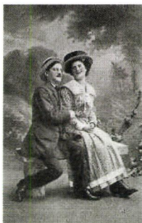
Kjærestekort ca. 1900

Tidligere var selskapelighetene i julen en periode da unge kvinner og menn hadde friere sosial omgang enn resten av året. Å leke kjærsteleker og ta ekteskapsvarsler hørte med i julehøytiden. At julen var en tid for flørt og frieri, viser også de eldste trykte julekortene. Kjærestekort, med bilder av en ung kvinne og en ung mann i en romantisk situasjon, var et av de vanligste motivene for julekort. Å sende et slikt kort