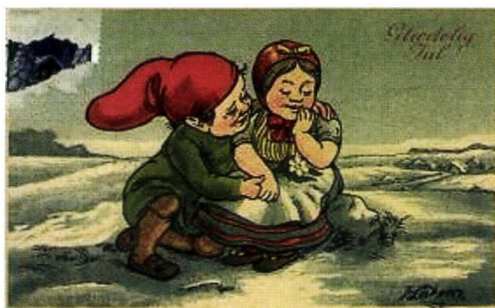
Kjærestekort med nisser 1912