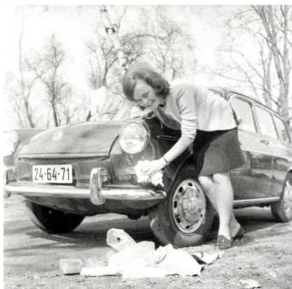
Vårpuss på bilen, dame vasker og steller bil. Fotografert 30. april 1966. NF.26959-995.

Jeg kjenner en mannlig førskolelærer som trengte en rørlegger en gang, de lo litt da rørleggeren som kom var jente. Snakk om kjønnsroller som er i utvikling! Kvinne, 1969, S63, 40941