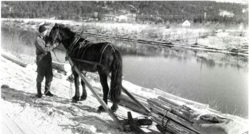
Østerdalen, mars 1959. Tømmertransport med hest. NFDB.26793-061.

Hestestellet hørte då til dei mange oppgåvene som saman utgjorde mannsrolla i bondeheimen. Dei som gjorde desse oppgåvene vart då «mannen». Kyrne tok kvinna seg av, rett nok til mjølkemaskina vart innført. Tidlegare var det periodar der kvinnene måtte gjere det meste, inne som ute.