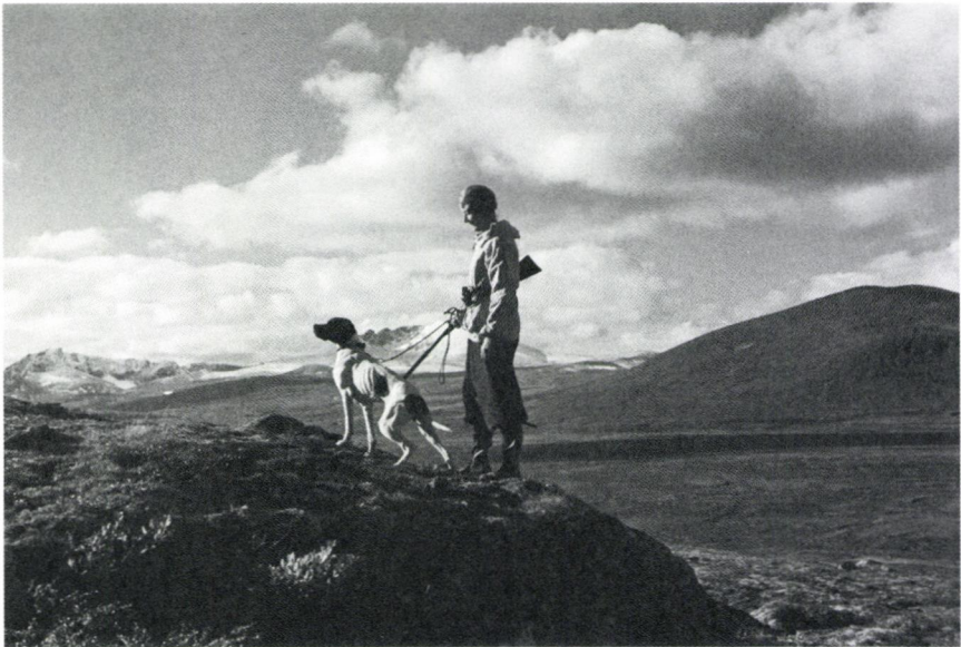
Anders Beer Wilse 1935: Kvinne med hund på jakt

Jeg er oppvokst med at begge mine foreldre jaktet, så det var naturlig å begynne med det. Den første turen var med far på skogsfugljakt i Grue Finnskog, der han bestyrte og eide skog. Dette var i oktober, og det ble mitt første møte med hvor sky fuglen kan være så sent på året. Vi både så og hørte de lettet mellom trestammene, men dessverre på alt for lang avstand. Jeg husker det som enormt frustrerende. Men også spennende, gikk med hjertet i halsen nesten hele tiden. Man vet aldri når det plutselig skjer. For meg er spenningen og naturopplevelsen det viktigste. Det å bevege meg i terrenget, lese det og vite at når som helst kan det fly opp fugl. (Kvinne f. 1971, Bærum i Akershus, 41230)