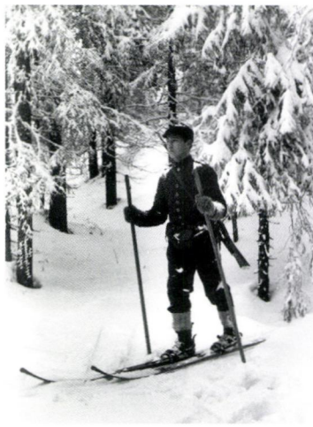
Jeger på ski

Som barn opplevde eg at mennene var ivrige i å gå på revejakt og «ta hi» som dei sa. Ein gong hadde fleire karar gått på sporsnø etter ein rev. I mørkningen såg dei spora slutta i ei ur. «Me røykjer han ut», sa dei og samla rusk og rask. Ved inngangen til ura sette dei seg med børsene klar, men han som skulle kveikja på sa: «Eg har ikkje fyrstikker, har de?» Nei, ingen hadde for ingen brukte tobakk. Ein annan gong kom to av morbrørne mine tidleg ein morgon for å gå på revejakt. Det var sporsnø. Dei gjekk på ski, men føret var tungt. Tidleg fann dei eit spor som gjekk lenger enn langt. I