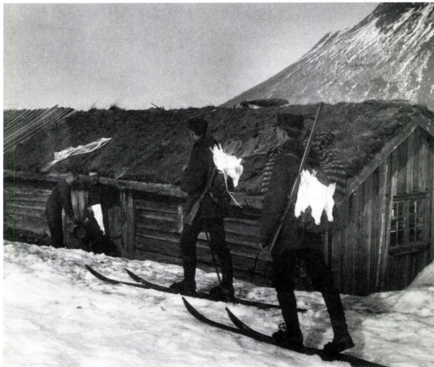
Rypejakt på Filefjell

Server med potet, grønnsaker og brun saus. Av grønnsaker brukar eg gulrøtter, rosenkål og brokkoli, men her kjem smak og behag. Brun saus smakar eg til med geitost (heimelaga) eller brun ost, kva ein har i huset. Tytebærrømme og flatbrød blir servert til. Tytebærrømme: 3 – 4 spiseskeier nyrørte tytebær blandast i 1 beger sæterrømme. Bon appettit! (Kvinne f. 1957, Vinje i Telemark, 41125)