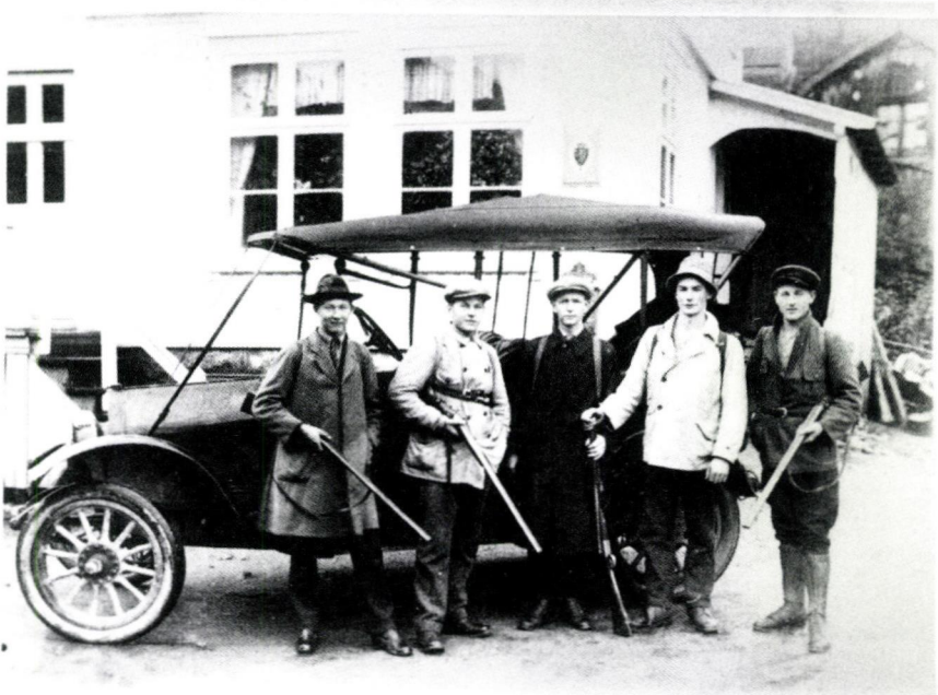
Jaktlag i Åseral i Vest-Agder.

(Mann f. 1927, Tingvoll i Møre og Romsdal, 41130)