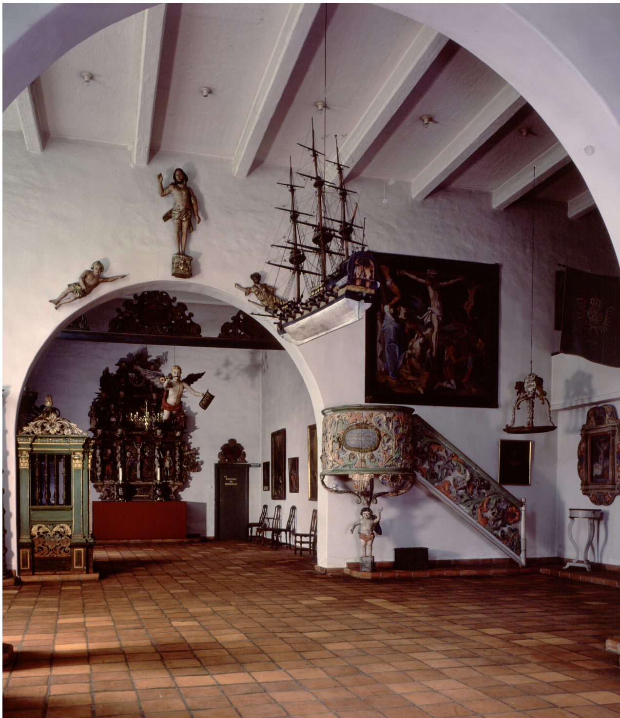
Fra utstillingen Norsk Kirkekunst på Norsk Folkemuseum. Dåpshuset til venstre.