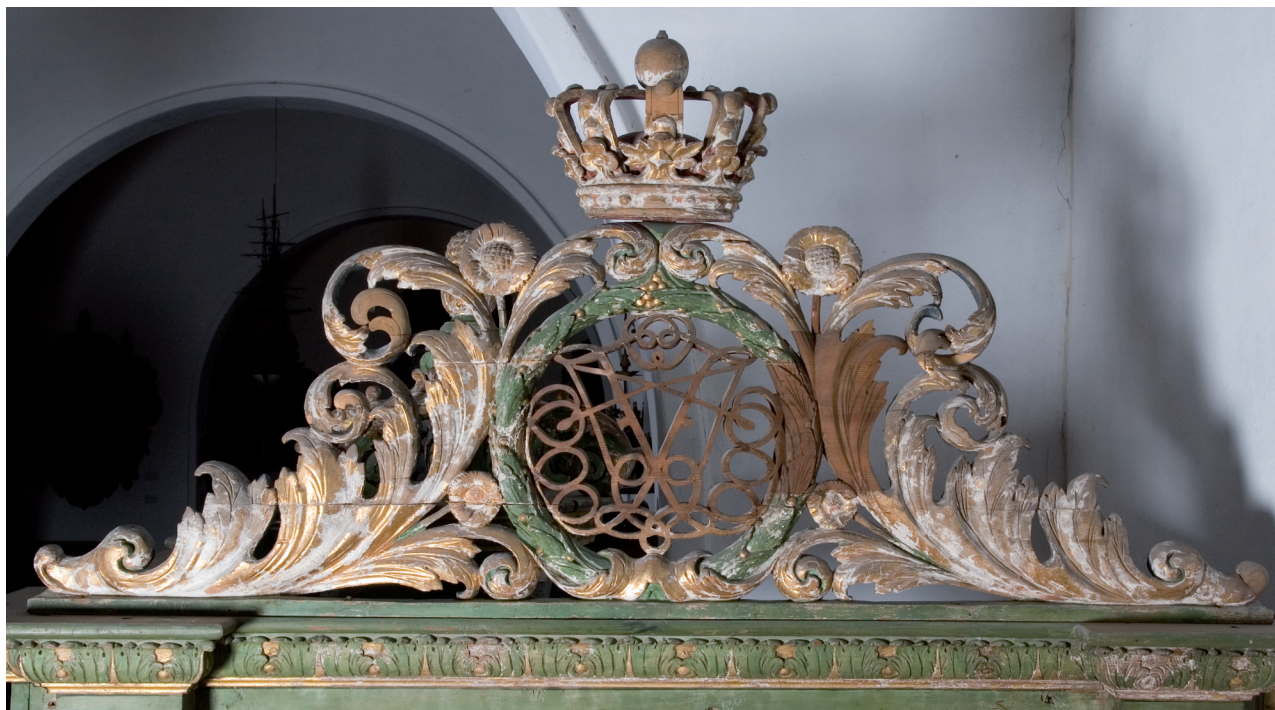
Monogrammet til Frederik IV av Danmark-Norge over inngangspartiet til dåpshuset fra Ringsaker kirke.

siden overlatt til museer på slutten av 1800-tallet (ibid:67). Gammelt etter-reformatorisk kirkeinteriør lå utvilsomt utenfor tidens smak på denne tiden. Da Oslo Domkirke ble ombygd på 1840-tallet, ble det gamle barokk-interiøret fra 1600-tallet betegnende nok omtalt som ”støtende for øyet og forstyrrende for andakten” og dermed fjernet (Melvold 2010:81).