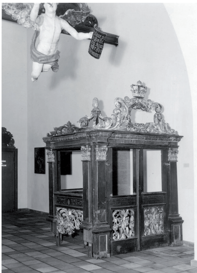
Dåpshuset fra Ringsaker kirke fotografert i museets samling av kirkekunst i 1938 – året det ble deponert til museet.

som jeg har skissert ovenfor? Først og fremst dreier det seg om hvordan dåpshuset er blitt tolket på nye måter, knyttet opp til forhold som gjelder 1) geografi, 2) stil og 3) funksjon. Filosofen Beth Lord påpeker i sin Foucault-inspirerte analyse av museet som heterotopi, at museet hovedsakelig dreier seg om fortolkning - forholdet mellom tingene og de ordene som beskriver dem. Museene viser fram gjenstandene, men de presenterer også systemer (Lord 2006, if. Eriksen 2009:118-119). Vi ser at betydningen som blir tillagt dåpshuset i den museale konteksten i stor grad har med representasjonen av gjenstanden å gjøre. Hvilke systemer og kategorier det har blitt og er satt i er viktig i forståelsen av dåpshuset.