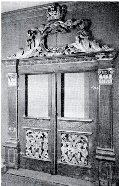
Fronten av dåpshuset fra Ringsaker kirke opphegt på Nordiska museet, ca.1927.

snidade eller målade föremålen förbisågos de enklare. Av samma grund blev också insamlandet ojämnt, det var de rikaste trakterna i landet, i första hand Telemarken och Gudbrandsdalen, som fingo giva tributen från sig. (...) Den norska samlingen kan av denna grund icke giva en instruktiv bild av landets allmogekultur i dess helhet. Det har därför också befunnits lämpligt att vid uppställandet icke följa landets av ålder vedertagna indelning efter dalarna utan att sammanföra föremålen efter den administrativa indelningen i amt (ibid:32-33).