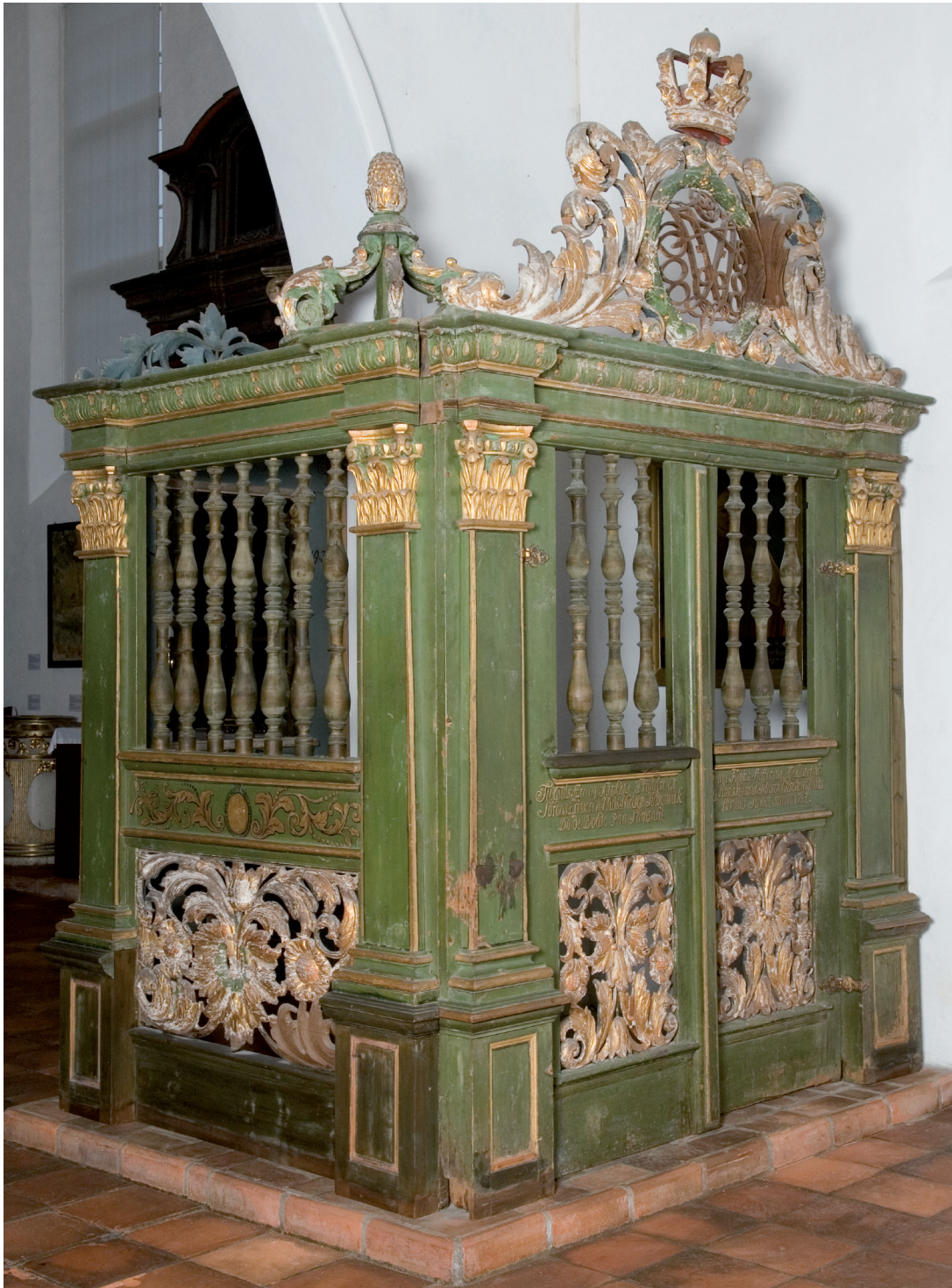
Dåpshuset fra Ringsaker kirke, bygget i 1704, utstilt på Norsk Folkemuseum.