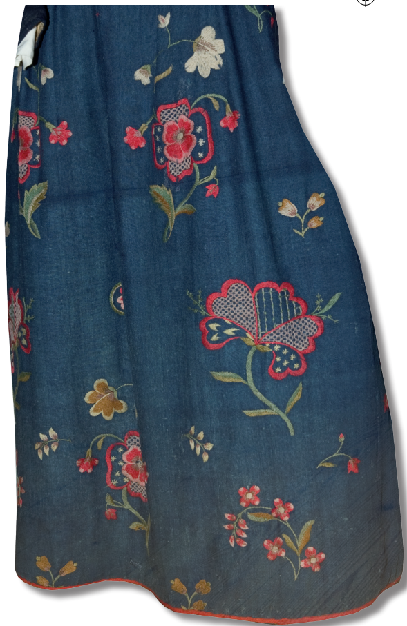
Brodert stakk fra Gudbrandsdalen

rosesaumen. 41 Ifølge Noss ble hvitt forkle brukt til rød stakk, mens svart forkle ble brukt til svart eller mørkeblå stakk (1991:215). Stemmer dette, skulle de rosesauma forklærne brukes til svart stakk. Kan det ha skjedd en endring fra at rosesauma forklær var andredagsforklær til at de ble brukt vigselfdagen sammen med svart stakk? På Selmers svart-hvitt foto er det vanskelig å se om bruda har rød eller svart stakk. Siden hun har hvitt forkle er det imidlertid grunn til å tro at den er rød. Siden den rituelle drakten gjerne endrer seg senere enn de andre (Lönnquist 1974), kan det være at svart brudestakk enda ikke var blitt vanlig 20 år etter at det først ble observert.