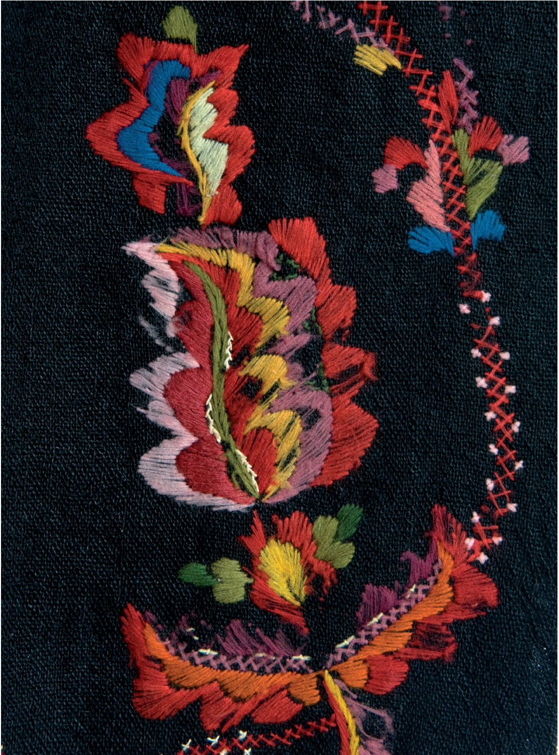
Detalj av Ane Ingebrigtsdatter Brudevolds forkle.