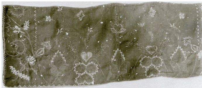
I følge registreringskortet fra 1926 er dette forklede fra Aurdal i Sykkylven fra første halvdel av 1700-tallet.