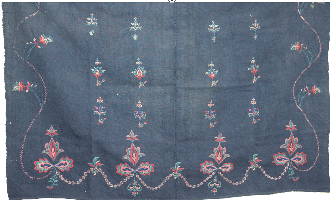
Dette brudeforklede fra 1798 i mønstergruppe 2 er det eldste bevarte rosesauma forklede fra Sunnmøre.

Forklede er brodert med løst tvunnet plantefarget ullgarn i mørk rød, høyrød, oransje, mørk gul, lys gul, mørk grønn, mellomgrønn, lys grønn, mørk blå, lys blå, mørk lilla, lys lilla, mørk rosa og lys rosa, og hvit - altså femten ulike farger. Rosesaumen danner et stort sammenhengende motiv jeg vil karakterisere som flammeaktig, der gule og røde farger dominerer. En bølget bord går langs ytterkanten på de tre frie sidene av forklede. Langs nedrekanten har borden fem store blomsterformer eller "roser". 10 Disse er ulike - en type i midten, en annen på hver side av denne, og en tredje type i hvert hjørne. Et smalt bånd binder dem sammen. Fra hjørnerosene går borden over i en blomsterslynge, der smale stengler med nelliker strekker seg helt til toppen av forklede. Hver blomst i slyngen er unik, men man finner igjen den samme på motsatt side.