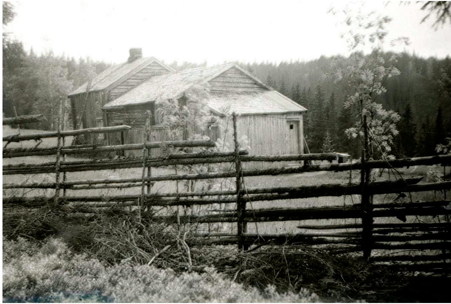
Husmannsplassen Okstad i 1956 sett fra nord.