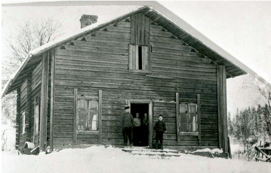
Plassen Ruud under gården Askerud i Eidskog. Bildet inngår i serie på tre fotografier samlet av Ingrid Semmingsen.