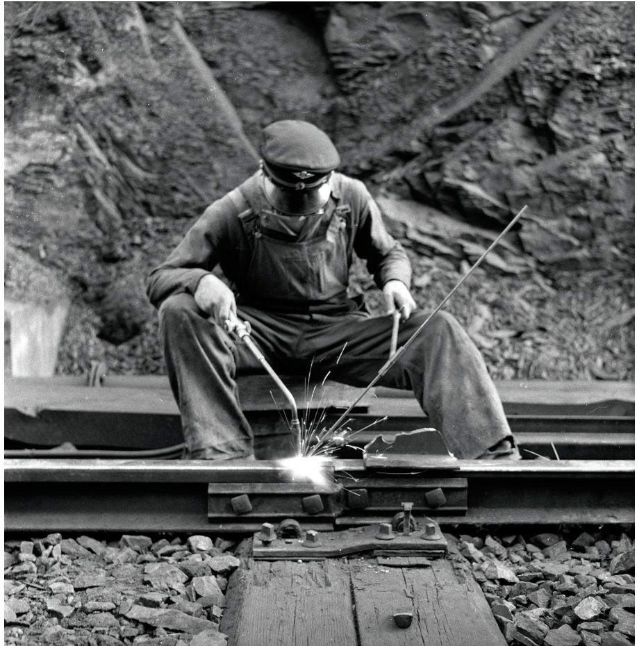
Arbeider på jernbanespor ved Drammen i mai 1953.