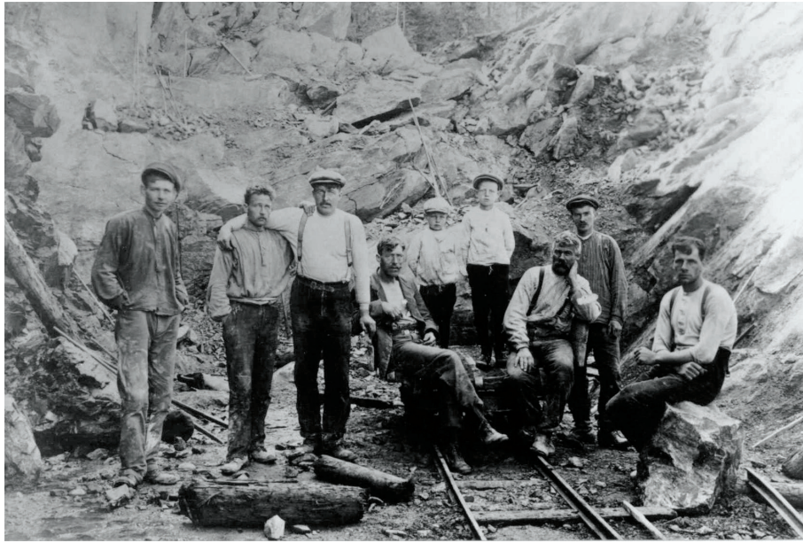
Jernbanearbeidere på Dovrebanen ved Rennebu, 1911-1913.