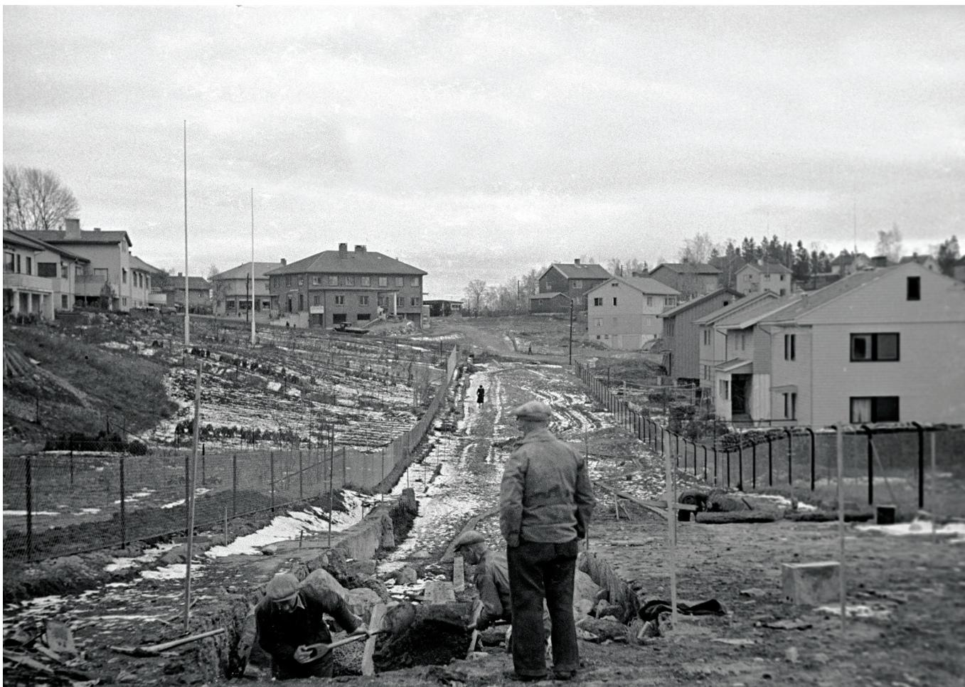
Røabanen blir forlenget til Lijordet i 1951. Arbeidere jobber i et boligområde med å grave ut den nye linjen.