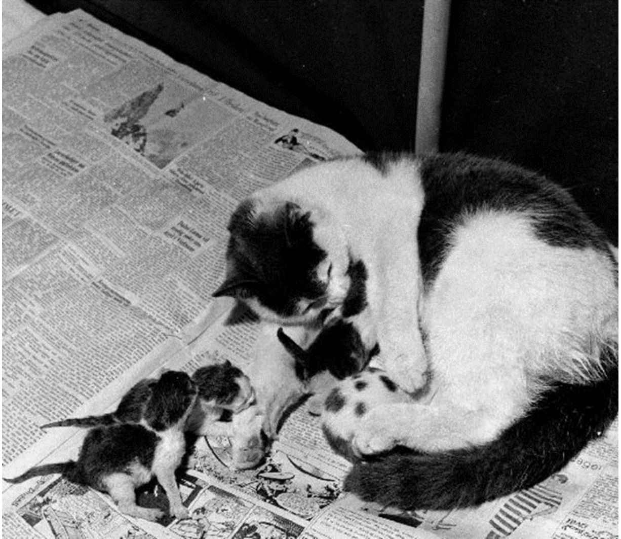
Kattemor med nyfødte unger.