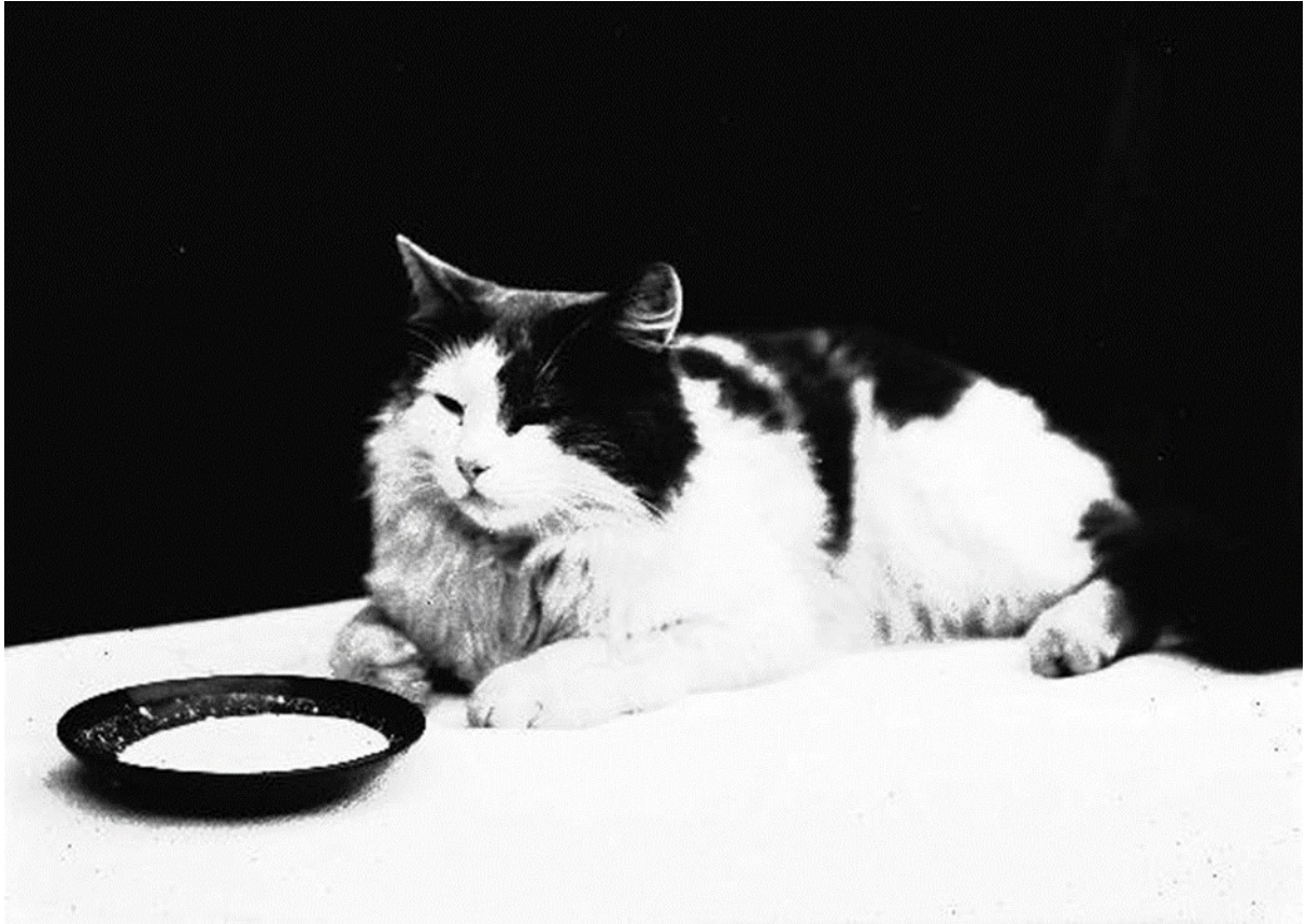
Katt på bordet.