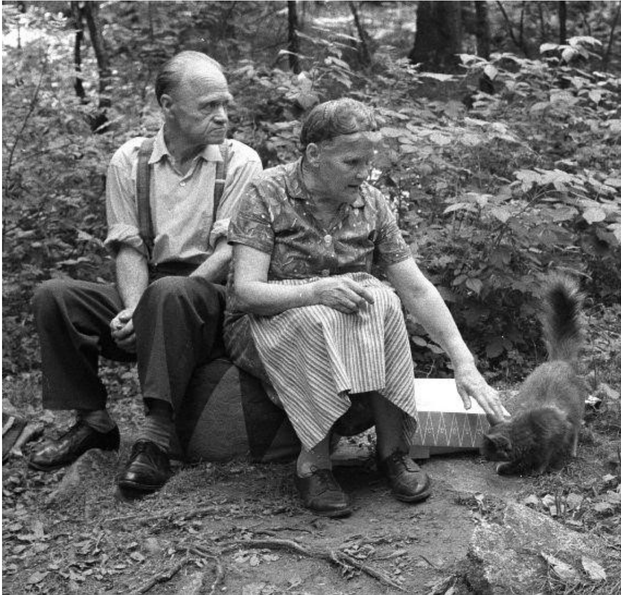
Eldre ektepar med katt, Merradalen ved Bogstadvannet 1969.